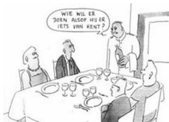
Bestuur ALTC Buitenveldert?